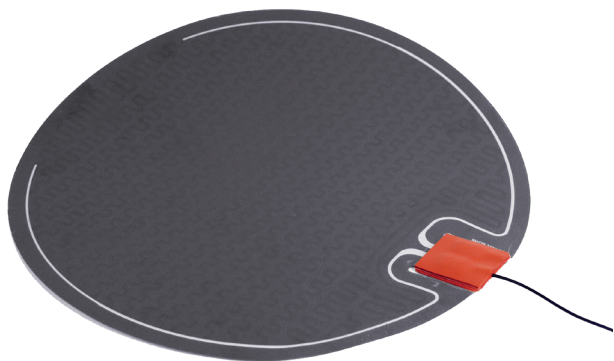
MAGNUM Look redondo