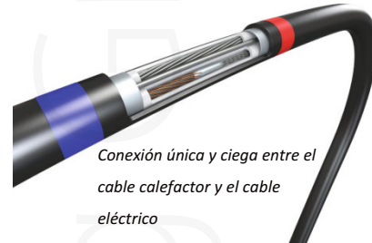
Conexión única y ciega entre el cable calefactor y el cable eléctrico